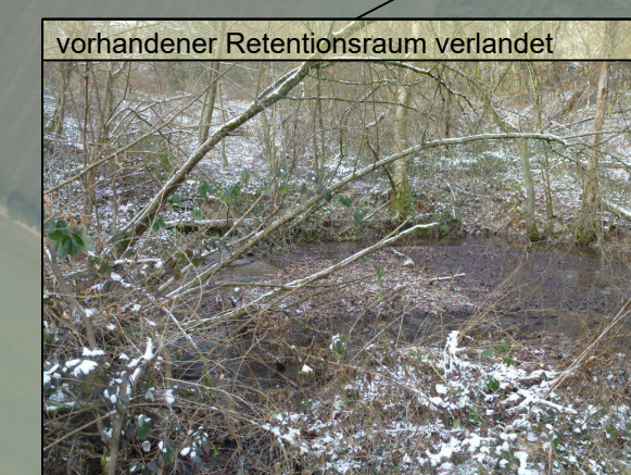
vorhandener Retentionsraum verlandet