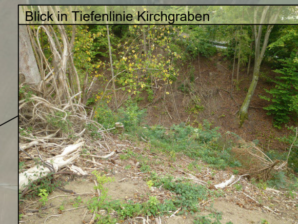
Blick in Tiefenlinie Kirchgraben