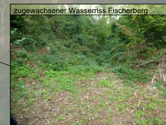
zugewachsener Wasserriß Fischerberg