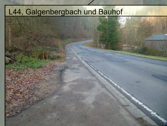
L44, Galgenbergbach und Bauhof