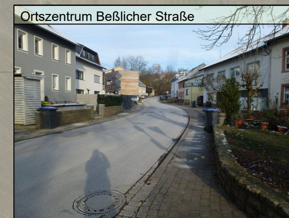
Ortszentrum Beßlicher Straße