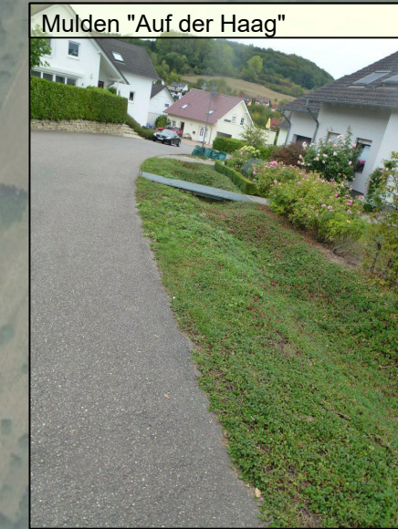
Mulden "Auf der Haag"