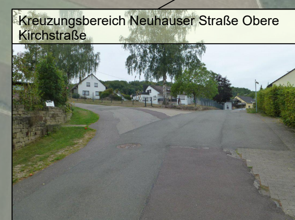
Kreuzungsbereich Neuhauser Straße Obere Kirchstraße