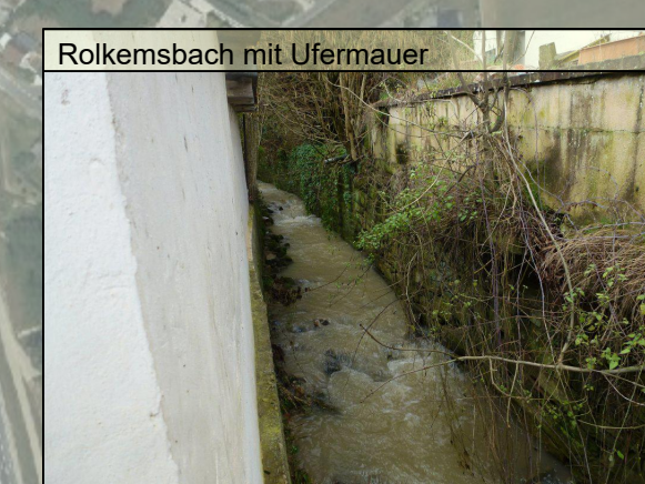
Roikernsbach mit Ufermauer