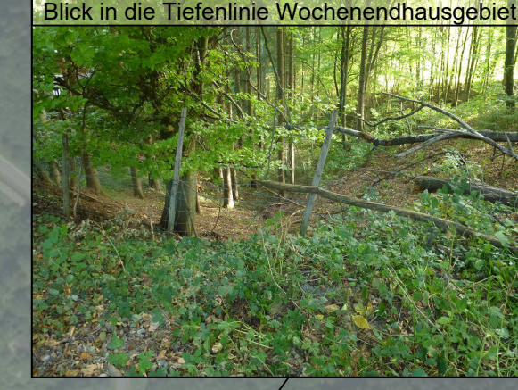
Blick in die Tiefenlinie Wochenendhausgebiet