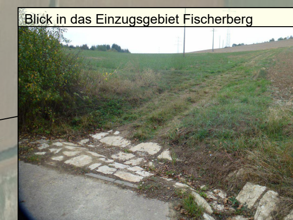
Blick in das Einzugsgebiet Fischerberg