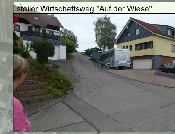
steiler Wirtschaftsweg "Auf der Wiese"