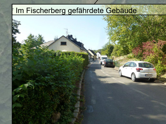
Im Fischerberg gefährdete Gebäude